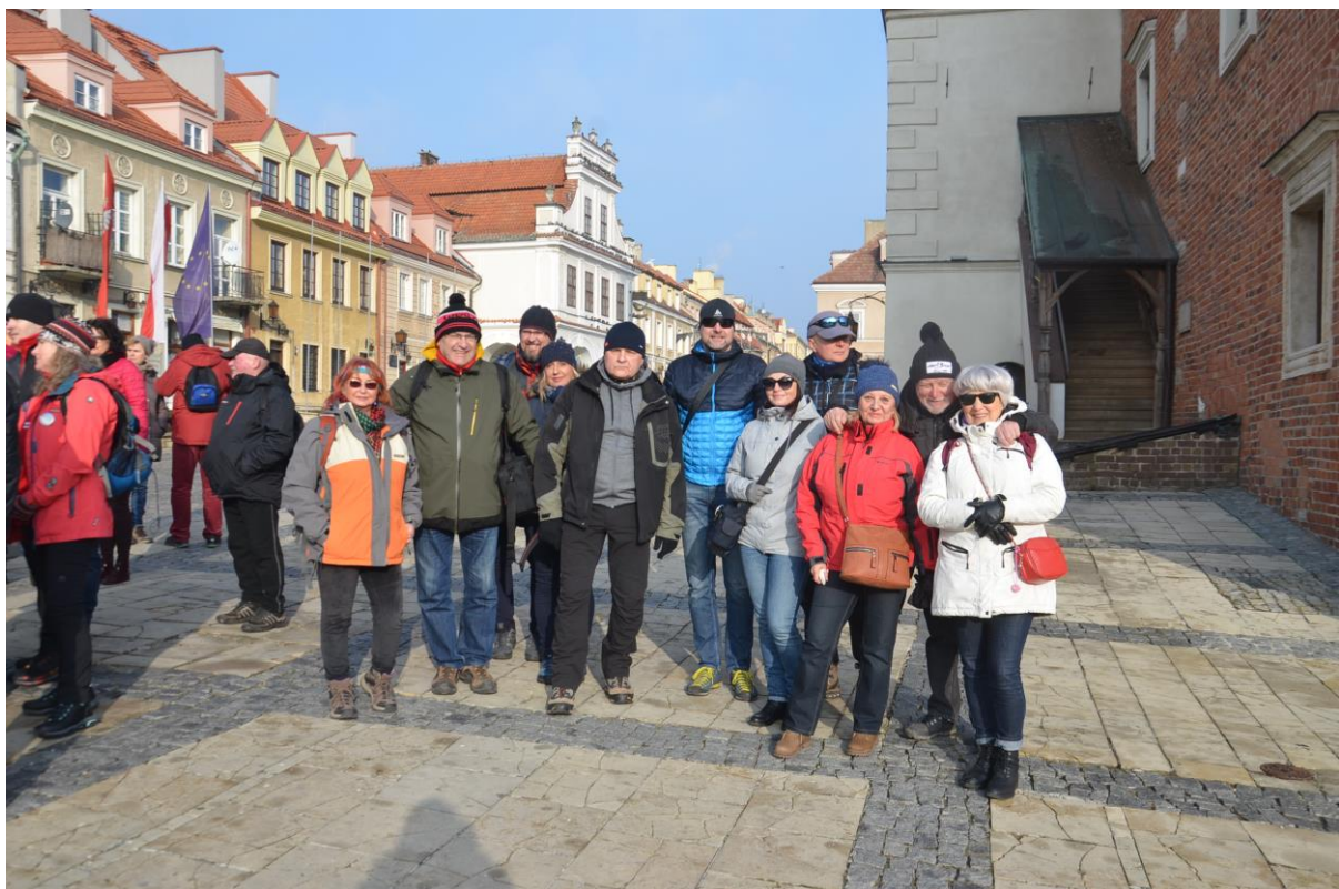
Członkowie O/PTT z Sosnowca na sandomierskim Rynku