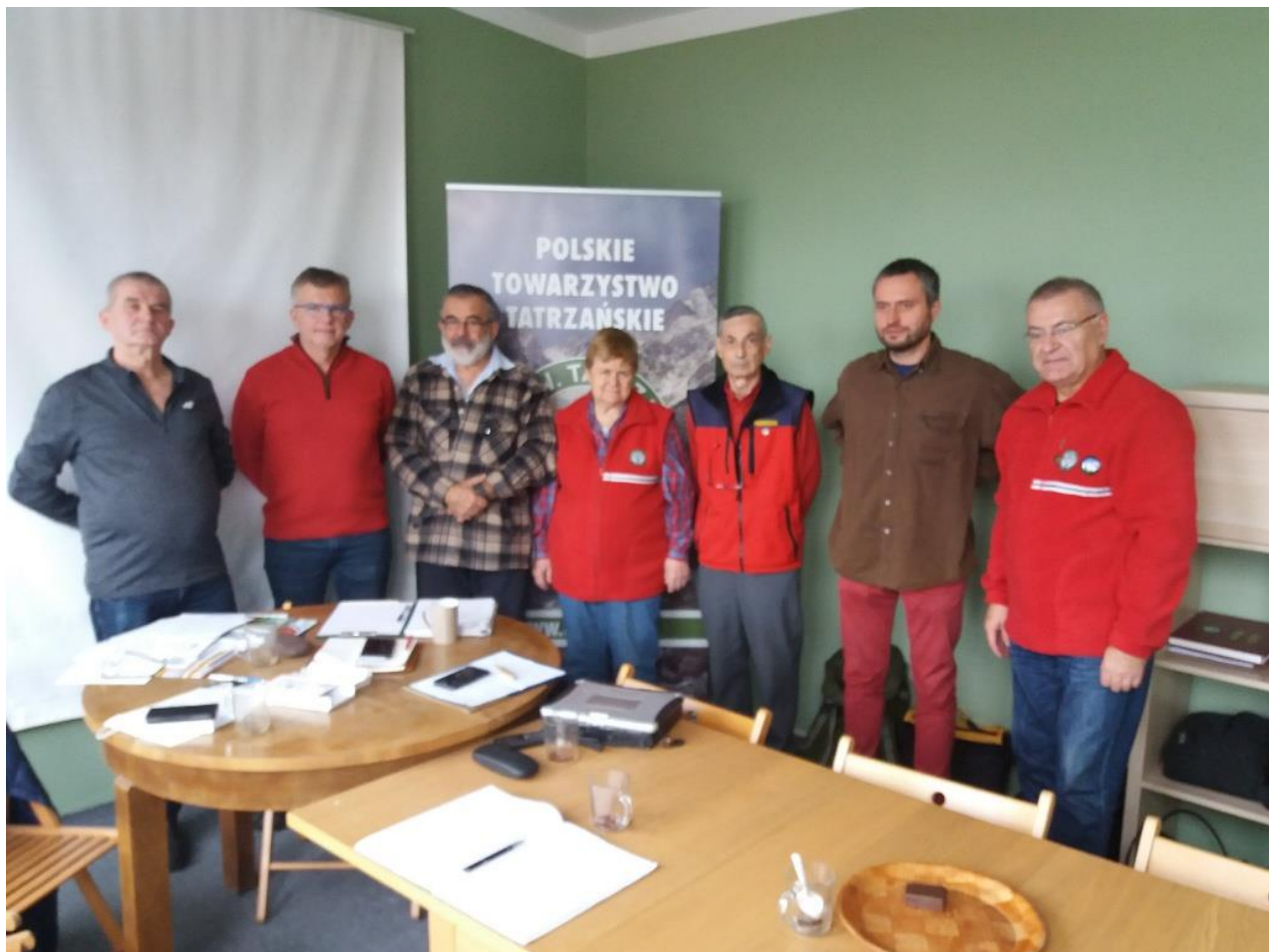
Relacja i foto: Zbigniew Jaskiernia