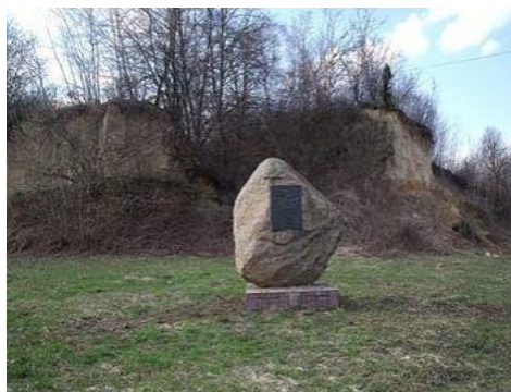
Pomnik upamiętniający bitwę pod Konarami

W pobliżu Klimontowa w drodze na Ujazd znajduje się miejscowość Konary. To pod tą miejscowością w dniach 16-25.05.1915 r. I Brygada Legionów pod dowództwem brygadiera Józefa Piłsudskiego stoczyła bitwę z Rosjanami. Brygada walczyła w ramach wojsk austro-węgierskich.