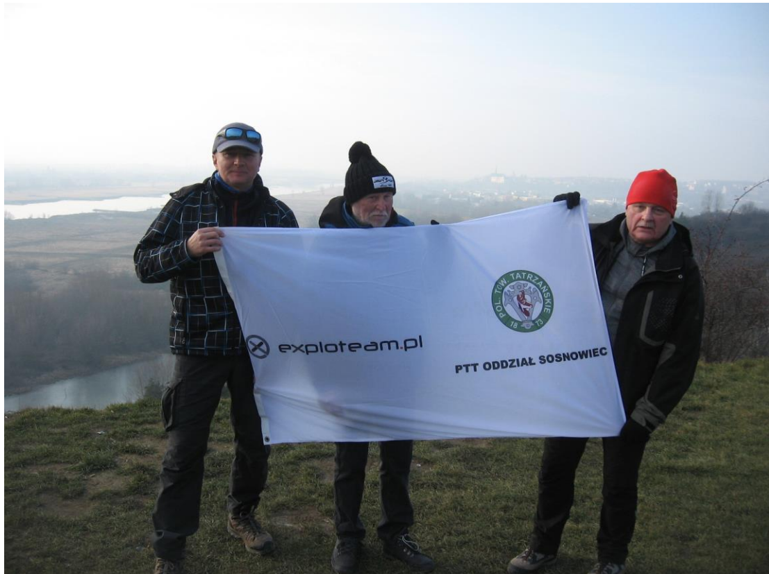
Góry Pieprzowe pod Sandomierzem