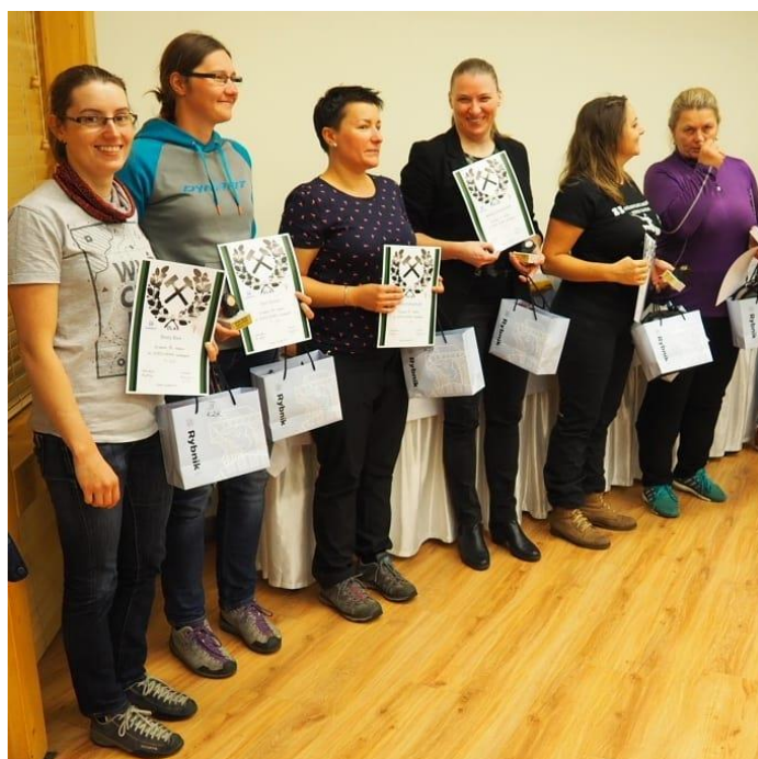
Wigilia w schronisku na Hali Boraczej: 14.12.2019 r.