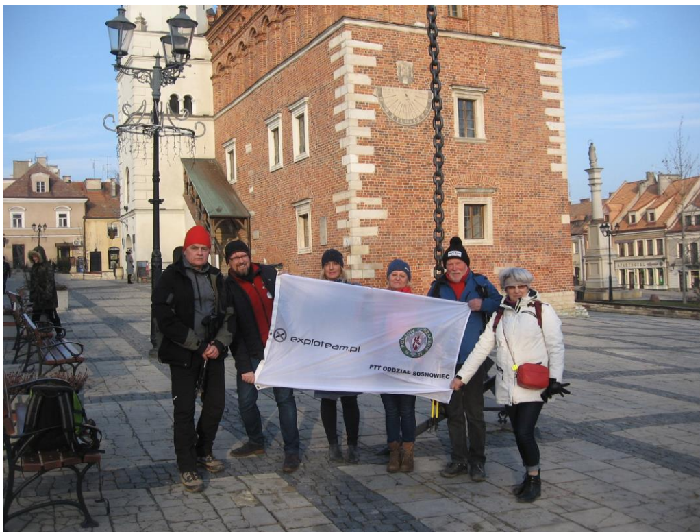
Na sandomierskim rynku przy kotwicy. Po prawej figura Matki Bożej z 1776 r.

Wieża została dobudowana w XVII w. W ratuszu znajdują się reprezentacyjne pomieszczenia Rady Miasta i Urząd Stanu Cywilnego. W pomieszczeniach na parterze mieści się oddział Muzeum Okręgowego.