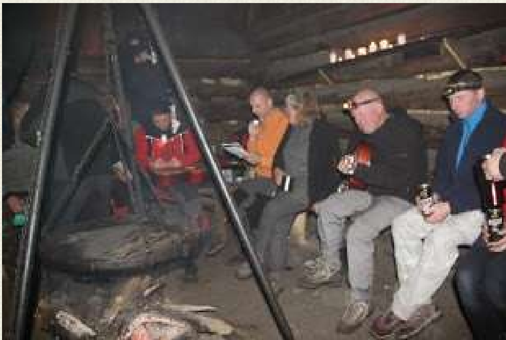
Wieczorem na Jasieniu jest zawsze wesoło.