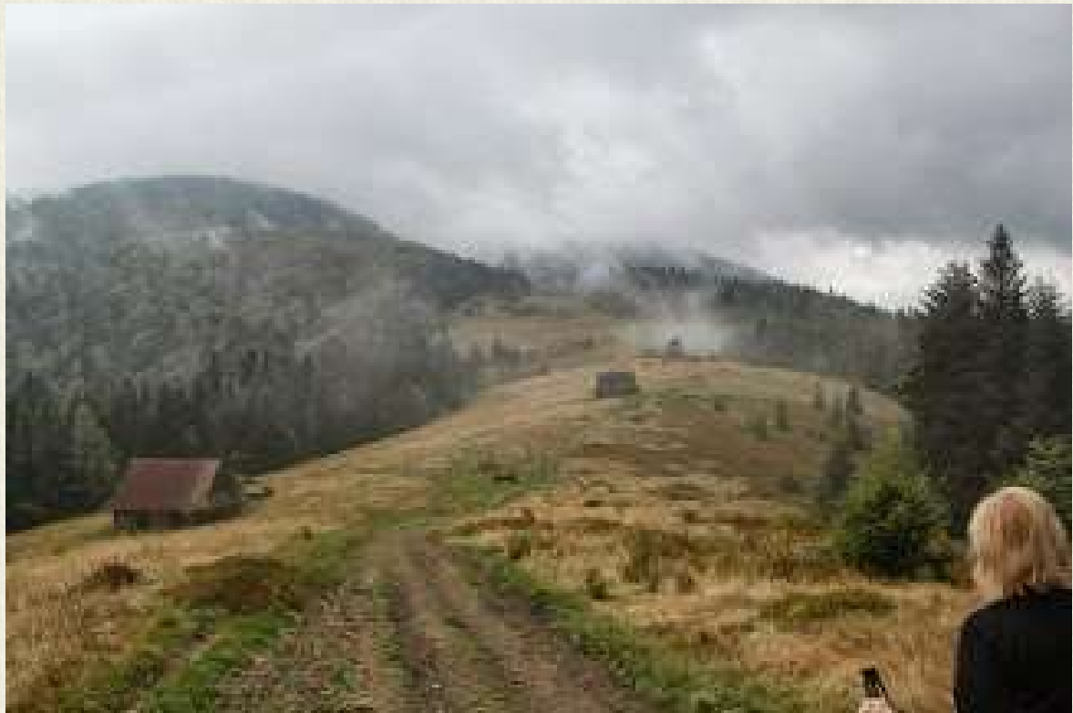
Cel jest już bliski