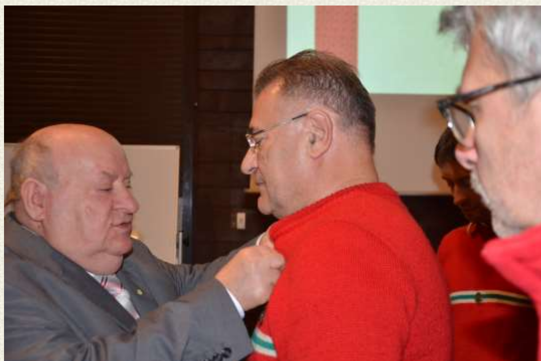
Dekoracja zasłużonych dla PTT