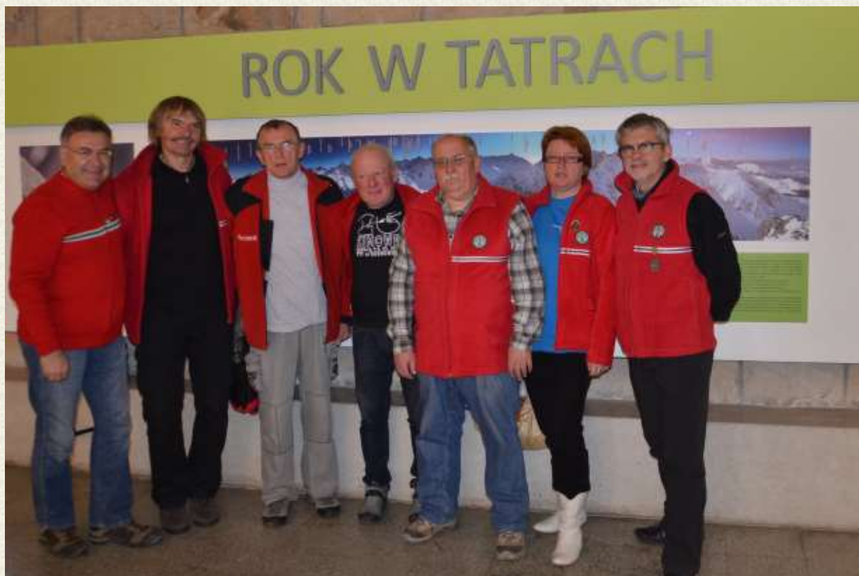
Zjazd to okazja do spotkania z przyjaciółmi z Oddziałów w Ostrzeszowie, Poznaniu i Radomiu