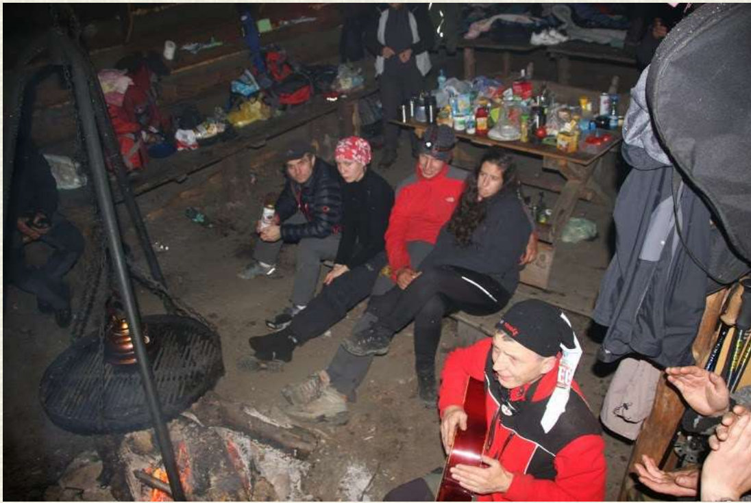
„Łosiu” dał pokaz swoich umiejętności