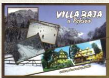
Na widokówce miejsce naszego zakwaterowania