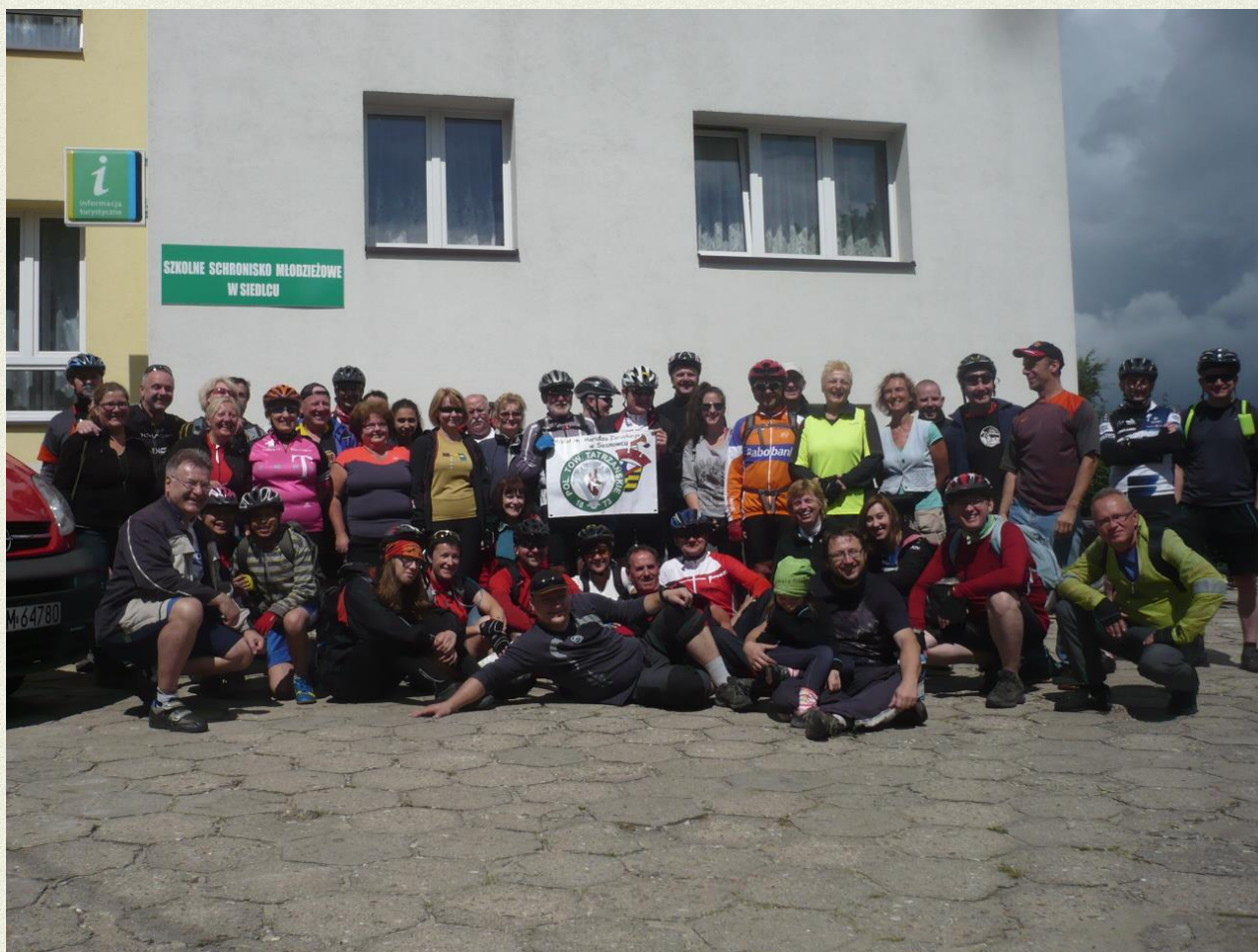
Opracowanie i zdjęcia: Zbigniew Jaskiernia

W trzecim dniu pożegnaliśmy się w Siedlcu z częścią uczestników, ale większość wyruszyła w drogę powrotną do Sosnowca. Trasa nasza wiodła przez: Zaborze- Żarki Letnisko- Pińczyce- Siewierz. Tutaj na rynku skonsumowaliśmy obiad, a potem powrót przez Pogorię IV do Będzina. Zakończenie rajdu odbyło się w Sosnowcu. W tej bardzo udanej imprezie wzięło udział 47 osób, a łącznie przejechaliśmy 230 km.