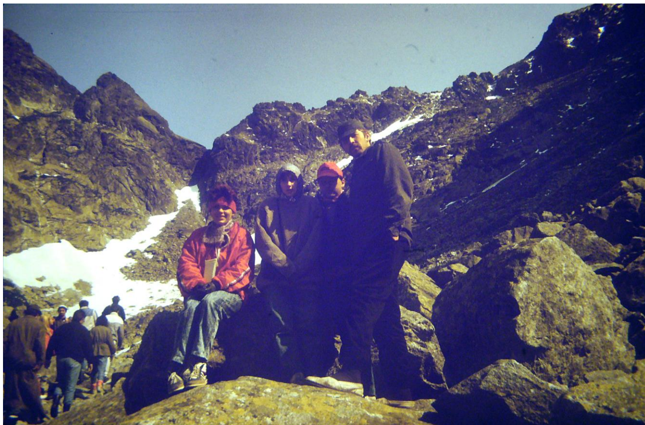
Na trasie podejścia na Rysy.

Warunki na trasie były dobre. Dopiero w szczytowej partii przed wejściem w rejon łańcuchów pojawił się śnieg. Warunki były tutaj znacznie trudniejsze.