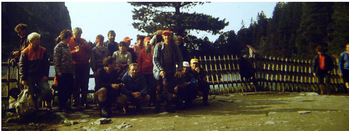
Przed wyjściem na trasę z Popradzkiego Jeziora

Warunki na trasie były dobre. Dopiero w szczytowej partii przed wejściem w rejon łańcuchów pojawił się śnieg. Warunki były tutaj znacznie trudniejsze.