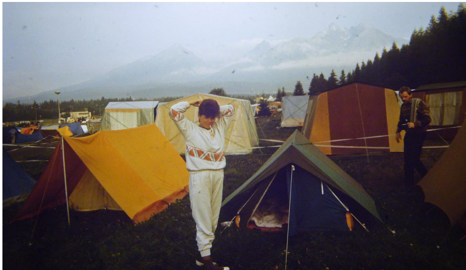
Nasze obozowisko w Tatrzańskiej Łomnicy

W dniach 2 – 6 sierpnia 1989 r. braliśmy udział w XXXIII Międzynarodowym Wejściu na Rysy. Do Tatrzańskiej Łomnicy powróciliśmy po roku. Trasa dojazdowa wiodła przez Łysą Polanę. Namioty rozbiliśmy na dużym campingu.