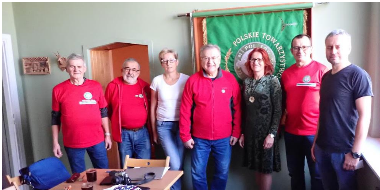
Opracowanie i foto: Zbigniew Jaskiernia

Dzięki dokonanej inwentaryzacji będzie można szybko skorzystać ze zgromadzonych zbiorów (dokumenty dotyczące PTT, gazetki oddziałowe, artykuły prasowe itp.). 6/ Kol. Prezes poinformowała, że do końca 2024 r. można zamawiać polary, koszuli i naszywki z logo PTT. 7/ Ustalono, że kolejne posiedzenie ZG PTT odbędzie się w Tarnowie w dniu 8 lutego 2025 r. Po wyczerpaniu porządku obrad posiedzenie zostało zakończone.