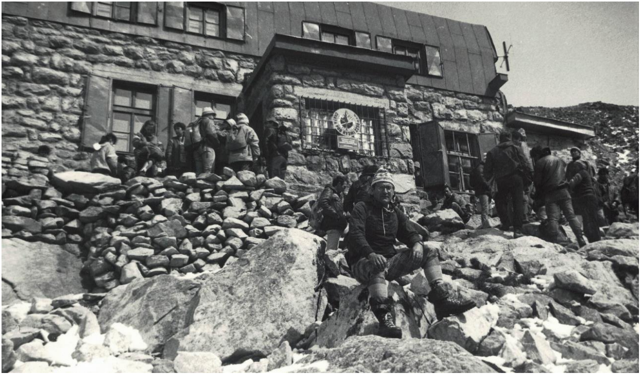
Przed schroniskiem na Wadze pod Rysami