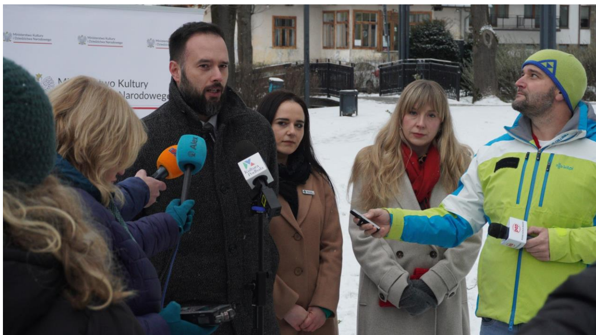
Konferencja prasowa dyrektora Muzeum Tatrzańskiego Michała Murzyna