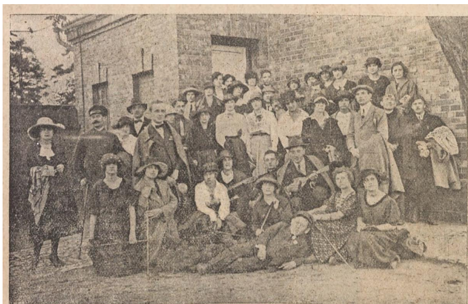
Jedna z wielu wycieczek czł. Domu Ludowego.