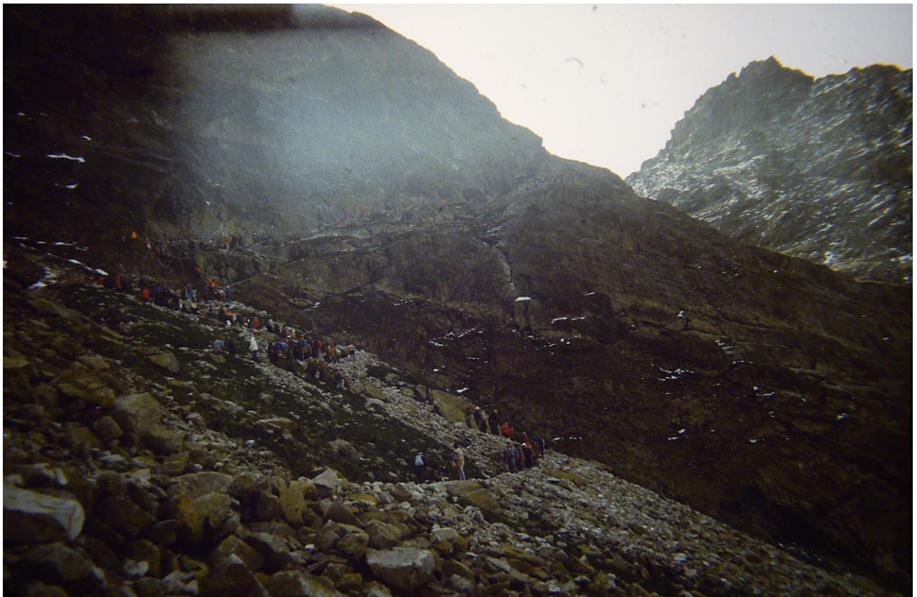
Podjeście na Rysy