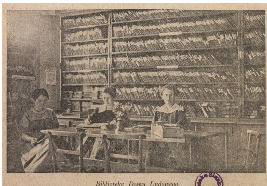
Biblioteka Domu Ludowego.

Dom Ludowy współpracował z Towarzystwem Uniwersytetów Robotniczych. Za główny cel stawiał sobie podniesienie wiedzy mas robotniczych. Na odczyty zapraszano m. in. lewicowych twórców, a wśród nich pisarza Adama Polewkę z Krakowa. Oprócz odczytów przygotowano wieczornice, tzw. Herbatki, wycieczki i inne imprezy. Z czasem aktywność Towarzystwa uległa znacznemu osłabieniu, spadła także liczba jego członków. W latach 1930 – 1934 wahała się ona od 200 do 300, w 1935 r. do Towarzystwa należało tylko 128 osób, a w 1937 r. 124 osoby. W końcu lat 30. Nie wykazywało ono prawie żadnej działalności, poza odbywaniem corocznych zebrań sprawozdawczo- wyborczych.