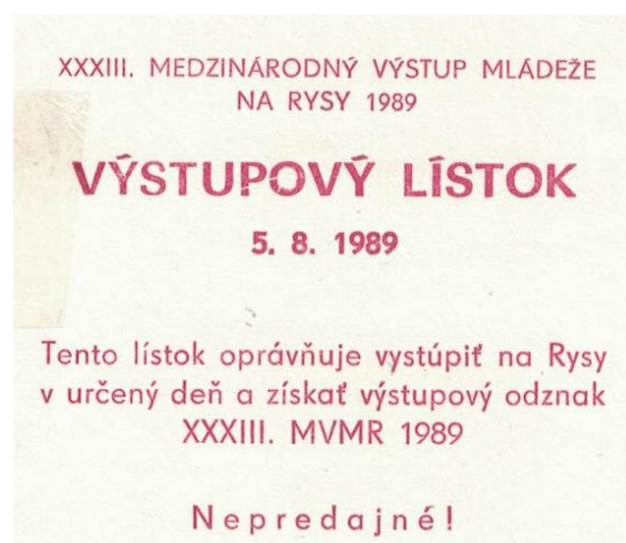
Dokument umożliwiający wejście na szczyt

W dniu 3 sierpnia braliśmy udział w konkursach przewidzianych przez organizatorów, a były to wyścigi na szczydach oraz bieg pod nazwą „Mila pokoju”. Do konkurencji wytypowaliśmy naszych najlepszych sportowców, a wyniki były całkiem zadawalające. Dzień 4 sierpnia był przewidziany na zakupy, które zrealizowaliśmy w Popradzie. Program turystyczny natomiast realizowaliśmy w Levočy. W godzinach wieczornych spotkaliśmy się w kolibie, przy ognisku i muzyce cygańskiej. Zasadnicza część naszego wyjazdu, czyli wejście na Rysy było przewidziane na 5 sierpnia. Każdy uczestnik otrzymał kwitek, który umożliwiał wejście w tym dniu na szczyt.