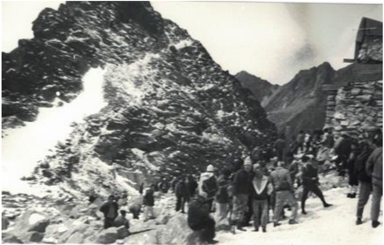
Widok na Wysoką spod schroniska na Wadze