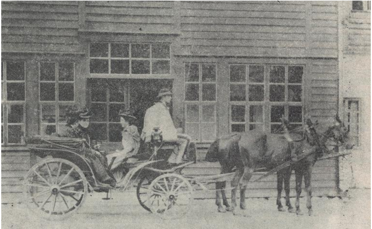
Przed zakładem w Kuźnicach

charakterystyczne białe czepce, dzięki którym górale nazywali je „cepculkami”. Nazwa ta przyjęła się ogólnie i do dnia dzisiejszego zachowała się w pamięci starych zakopiańczyków. Używali jej też ludzie piszący o dawnym Zakopanem.