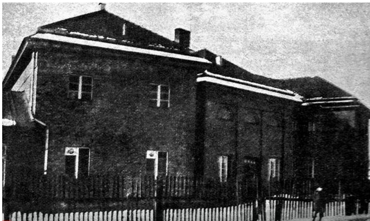
Łaźnia Miejska w Sosnowcu

W latach 60. XX wieku władze miejskie podjęły decyzję o przekształceniu łaźni w zakład kąpielowo - leczniczy. Planowano m. in. wprowadzenie kąpeli jodobromowych i kwasowęglówki, a także otwarcie gabinetów lekarskich oraz salonu masaży. Realizacja projektu opracowanego przez Wojewódzkie Biuro Projektów w Katowicach trwała do połowy lat 70. Utworzony Zakład Przyrodolecznicy czynny był do lutego 1999 r. Po wykonaniu prac adaptacyjnych w 2004 r. w obiekcie powstało Centrum Edukacji i Wychowania Młodzieży „KANA”.