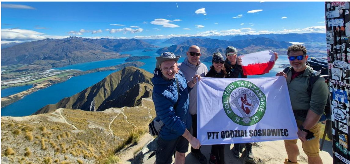
Pozdrowienia z Nowej Zelandii

: POLSKIE TOWARZYSTWO TATRZAŃSKIE Oddział/PTT im.Gen. M.Zaruskiego w Sosnowcu