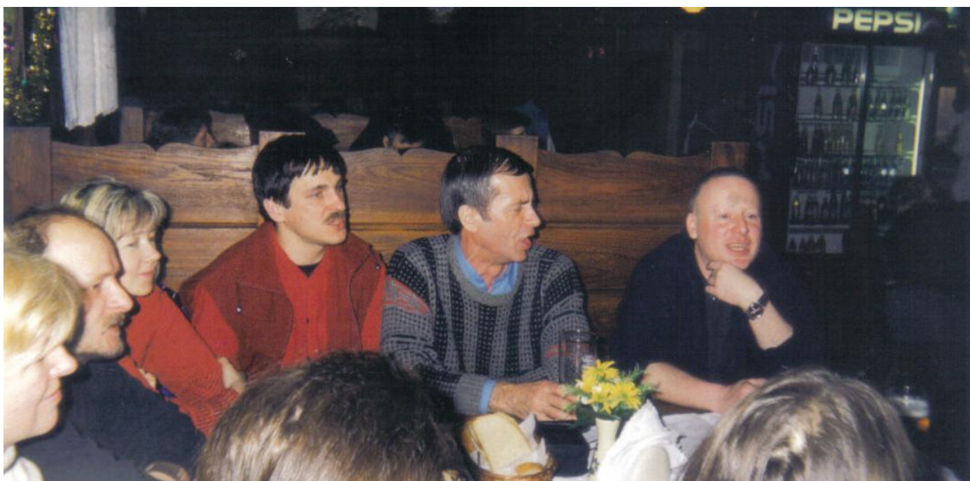
Opracowanie :Zbigniew Jaskiernia