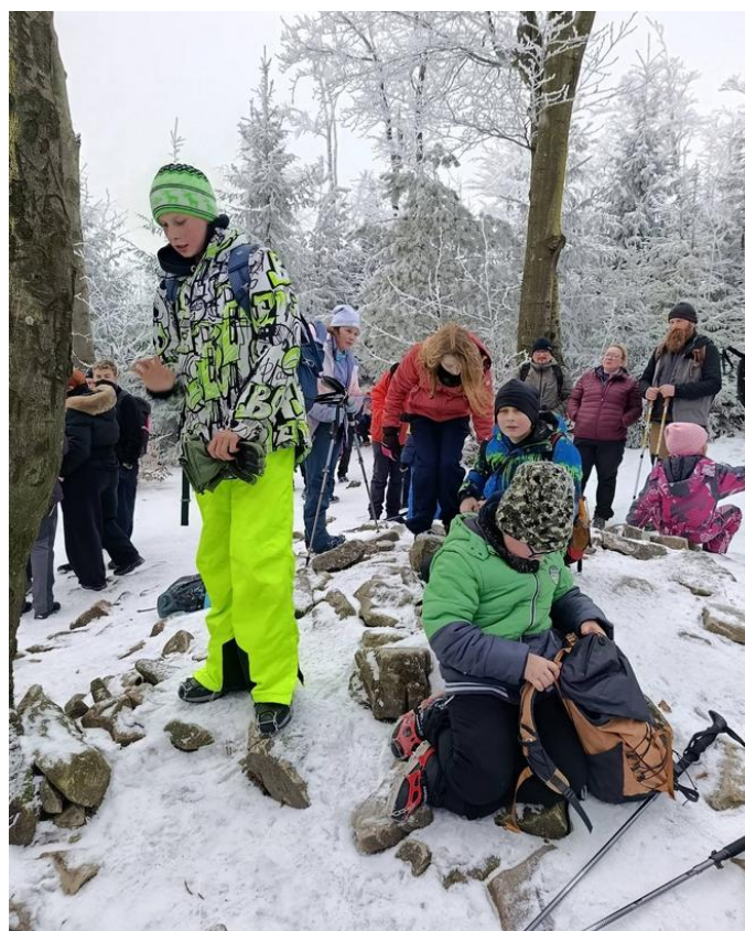
Opracowanie: Katarzyna Kaczmarczyk