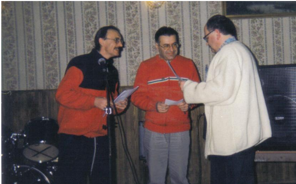
Wręczenie nagród dla wyróżnionych osób i Oddziałów PTT

Po zakończeniu części oficjalnej rozpoczął się koncert zespołu „Wolna Grupa Bukowina”. Artyści stworzyli niezapomnianą atmosferę i bisów było bardzo dużo.