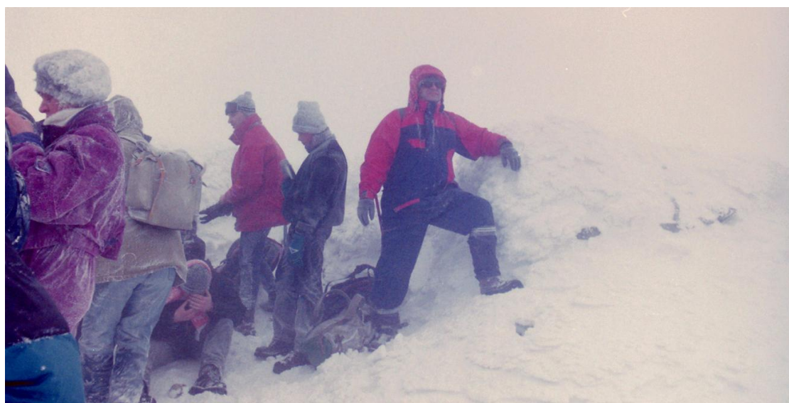
Na szczycie Babiej Góry