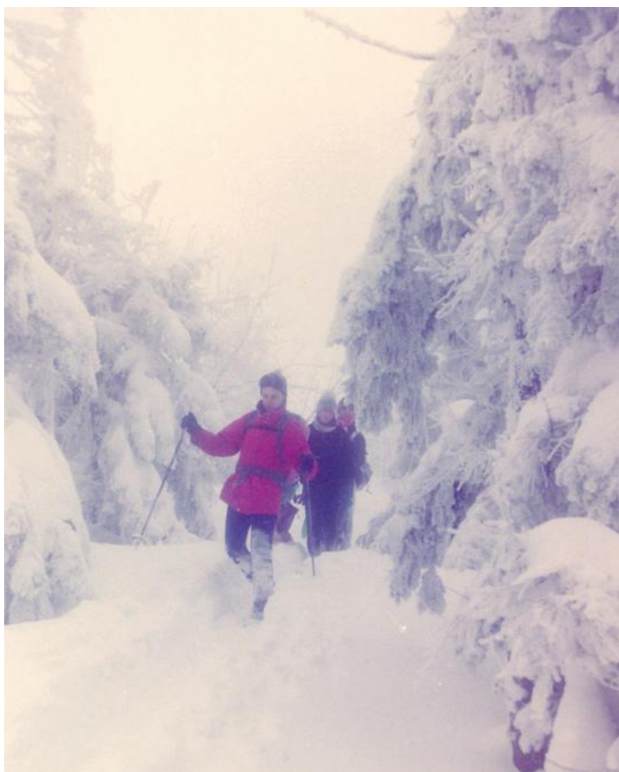
Zejsście ze szczytu w kierunku Przełęczy Brona.