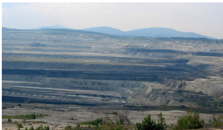
Kopalnia Węgla Brunatnego „Turów”